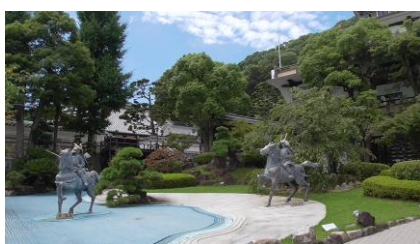
大本山須磨寺・源平の庭

JR 須磨駅から須磨寺までの行程 約 2,2Km 全行程（JR 須磨駅から JR 須磨駅）約 3,5Km ガイド時間除く徒歩の所要時間 約 40 分